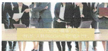
人財のSDGsへの取り組み