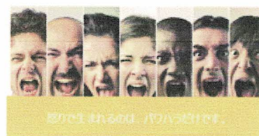
怒りが生むのはパワーハラだけです