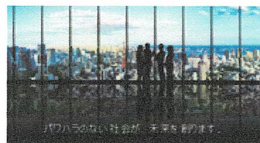
パワーハラのない社会が未来を創る