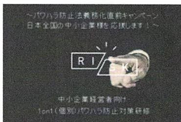
パワーハラ防止法義務化直前キャンペーン