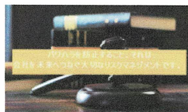
パワーハラ防止は大切なリスクマネジメント