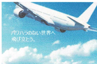
パワーハラのない世界へ飛び立とう